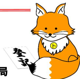
不動産登記推進イメージキャラクター 「トウキツネ」