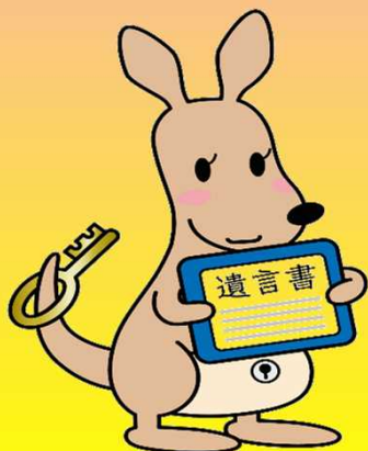
遺言書保管ガルー