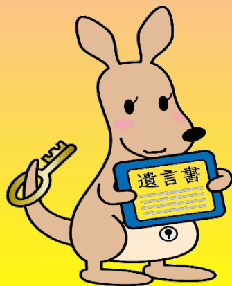
遺言書保管ガルー