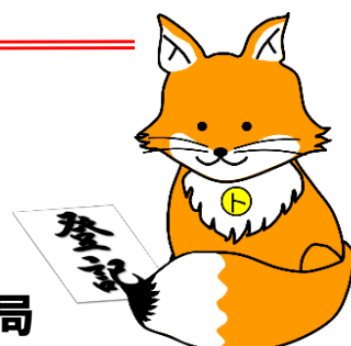
不動産登記推進イメージキャラクター 「トウキツネ」